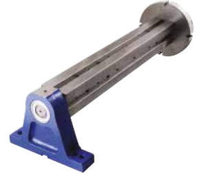
Yatak = Nr.2460