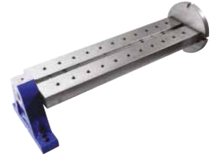
Yatak = Nr.2460