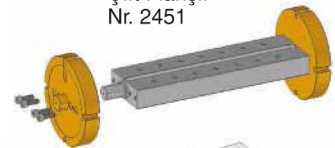
Çift Flanşlı Nr. 2451