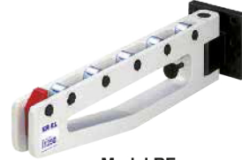
Model RE Katlamalı / Folding